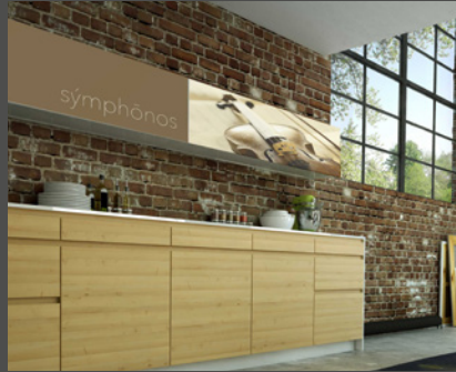
Türfronten und Küchenspiegel