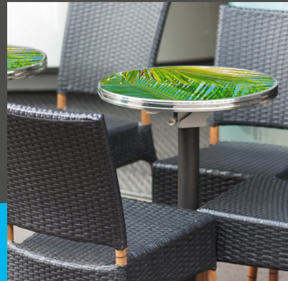
Tischplatten aller Formen